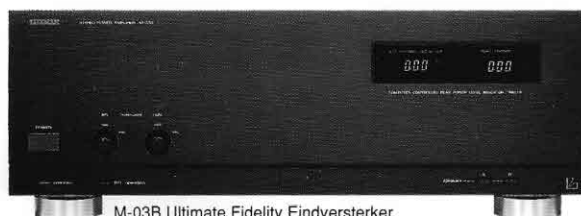
M-03B Ultimate Fidelity Eindversterker