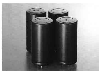
Blokcondensatoren van 15000 \mu F

de reactietijd is veel nauwkeuriger dan van de gebruikelijke meters. De inschakelbare 'piek-vasthoud'-functie maakt een uiterst nauwkeurige uitlezing mogelijk en het display kan worden ingesteld voor vier, zes of acht ohm. • Andere voorzieningen: Extra grote luidsprekerklemmen voor zware bekabeling. Volledig discrete schakelingen met zorgvuldig geselecteerde onderdelen. Plus de exclusieve Duo- \beta -schakeling van Luxman met de juiste hoeveelheid negatieve tegenkoppeling.