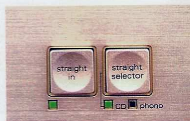
Separate Schalter für die Phono- und CD-Direkt-Betriebsart

nale verarbeitet, und den Zwischenverstärker steht je eine separate Stromversorgung zur Verfügung.